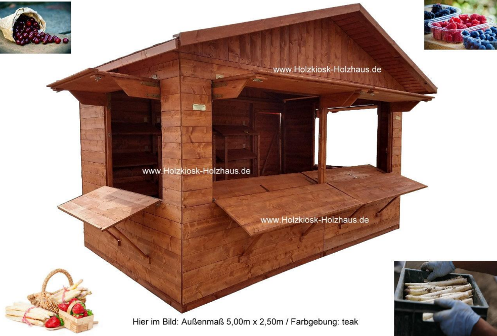
Hier im Bild: Außenmaß 5,00m x 2,50m / Farbgebung: teak