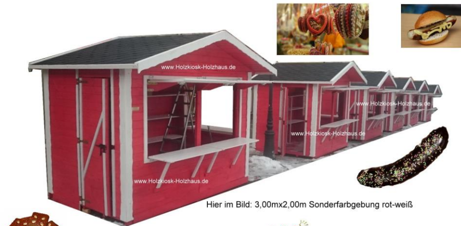
Hier im Bild: 3,00mx2,00m Sonderfarbgebung rot-weiß

Gerne erstellen wir ein individuelles Angebot für Sie: info@holzkiosk-holzhaus.de