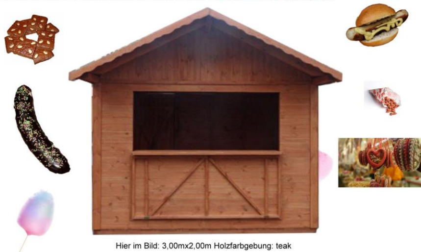
Hier im Bild: 3,00mx2,00m Holzfarbgebung: teak

Gerne erstellen wir ein individuelles Angebot für Sie: info@holzkiosk-holzhaus.de