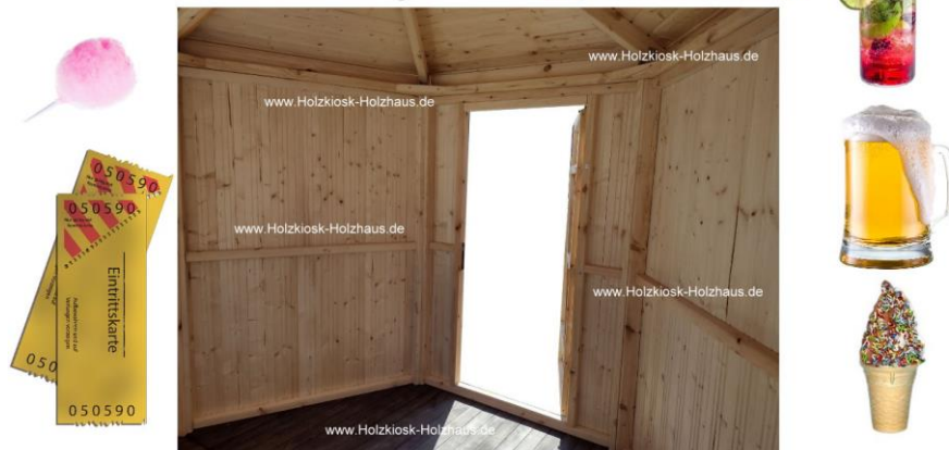
Hier im Bild: Durchmesser 3,00m, Farbgebung: FARBLOS/NATUR (Fußboden: palisander) imprägniert innen und außen

Gerne erstellen wir ein individuelles Angebot für Sie: info@holzkiosk-holzhaus.de