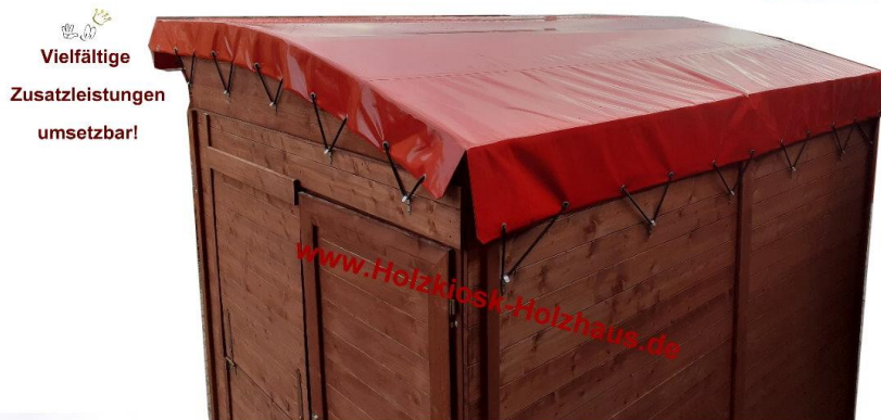
Außenmaß hier im Bild: 3,00m x 2,00m, Farbgebung "mahagoni"