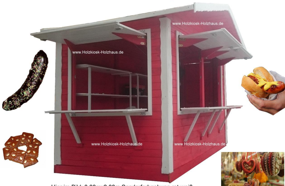
Hier im Bild: 3,00mx2,00m Sonderfarbgebung rot-weiß

Gerne erstellen wir ein individuelles Angebot für Sie: info@holzkiosk-holzhaus.de