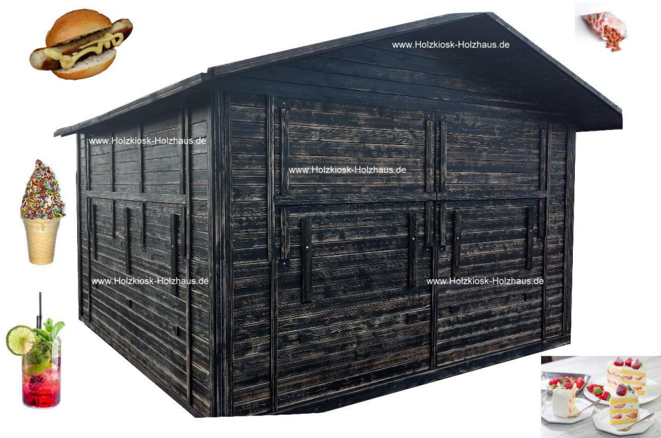
Hier im Bild: Außenmaß 4,00m x 3,50m, Farbgebung: antikschwarz (Sonderfarbgebung)

Geräumig, multifunktionell, robust - das ist unser Modell "Multistar XL". Sowohl für Verkauf als auch für Gastronomiekonzepte bestens geeignet. In nahezu jeder Größe für Ihr Projekt herstellbar. Gerne erstellen wir ein individuelles Angebot für Sie: info@holzkiosk-holzhaus.de