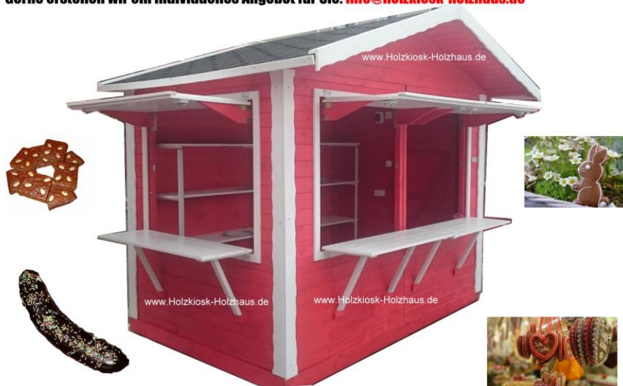
Hier im Bild: 3,00mx2,00m Sonderfarbgebung rot-weiß

Gerne erstellen wir ein individuelles Angebot für Sie: info@holzkiosk-holzhaus.de