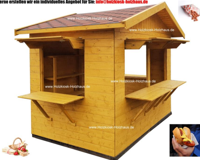
Hier im Bild: Außenmaß 3,00m x 2,00m / Farbgebung Hüttenkorpus: "kiefer", Fußboden: "palisander"

Ob für Spargelverkauf, als kleine Imbissküche oder als Verkaufshütte auf dem Weihnachtsmarkt/Kirmes - unser Modell "Stadtfest" ist ein echter "Alleskönner". Wie immer bei uns - in (fast) jeder benötigten Größe herstellbar! Die Anzahl, Größe und Position von Verkaufsklappen passen wir individuell nach Ihren Vorgaben an. Gerne erstellen wir ein individuelles Angebot für Sie: info@holzkiosk-holzhaus.de