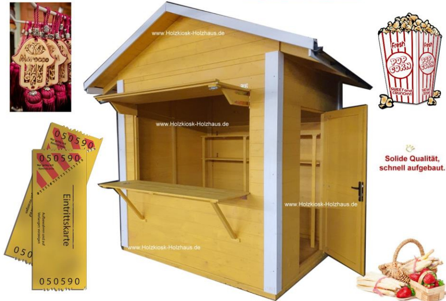
Hier im Bild: Außenmaß 2,50m x 2,00m, Farbgebung: gelb-weiß (Sonderfarbgebung)

Platzsparend, robust, durchdacht - das ist unser Modell "Minishop". Sowohl für Verkauf als auch für kleinere Gastronomiekonzepte bestens geeignet. In nahezu jeder Größe für Ihr Projekt herstellbar. Gerne erstellen wir ein individuelles Angebot für Sie: info@holzkiosk-holzhaus.de