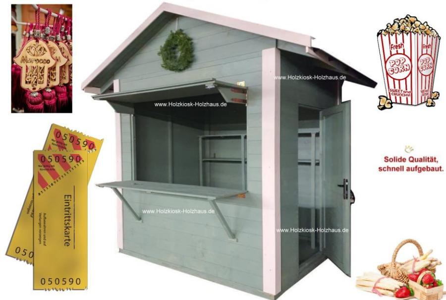
Hier im Bild: Außenmaß 2,50m x 2,00m, Farbgebung: grau-weiß (Sonderfarbgebung)

Platzsparend, robust, durchdacht - das ist unser Modell "Minishop". Sowohl für Verkauf als auch für kleinere Gastronomiekonzepte bestens geeignet. In nahezu jeder Größe für Ihr Projekt herstellbar. Gerne erstellen wir ein individuelles Angebot für Sie: info@holzkiosk-holzhaus.de