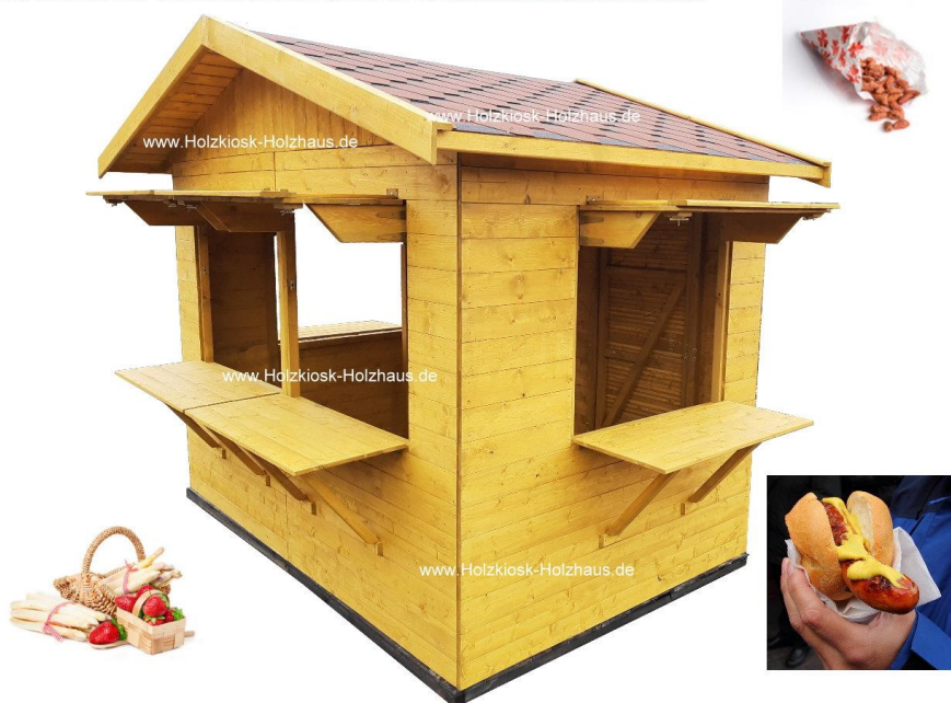
Hier im Bild: Außenmaß 3,00m x 2,00m / Farbgebung Hüttenkorpus: "kiefer", Fußboden: "palisander"

Ob für Spargelverkauf, als kleine Imbissküche oder als Verkaufshütte auf dem Weihnachtsmarkt/Kirmes - unser Modell "Stadtfest" ist ein echter "Alleskönner". Wie immer bei uns - in (fast) jeder benötigten Größe herstellbar! Die Anzahl, Größe und Position von Verkaufsklappen passen wir individuell nach Ihren Vorgaben an. Gerne erstellen wir ein individuelles Angebot für Sie: info@holzkiosk-holzhaus.de