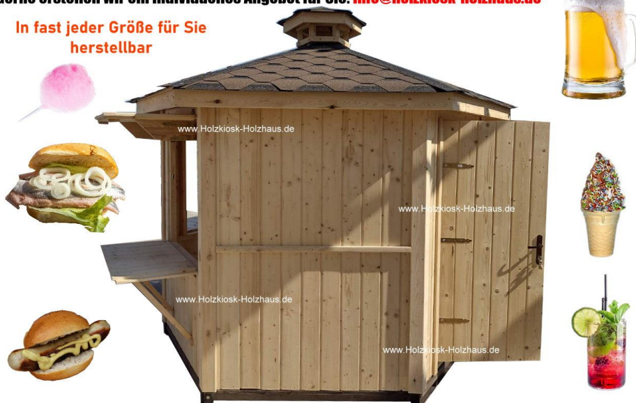
Hier im Bild: Durchmesser 3,00m, Farbgebung: FARBLOS/NATUR imprägniert innen und außen