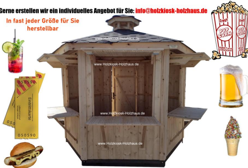
Hier im Bild: Durchmesser 3,00m, Farbgebung: FARBLOS/NATUR imprägniert innen und außen