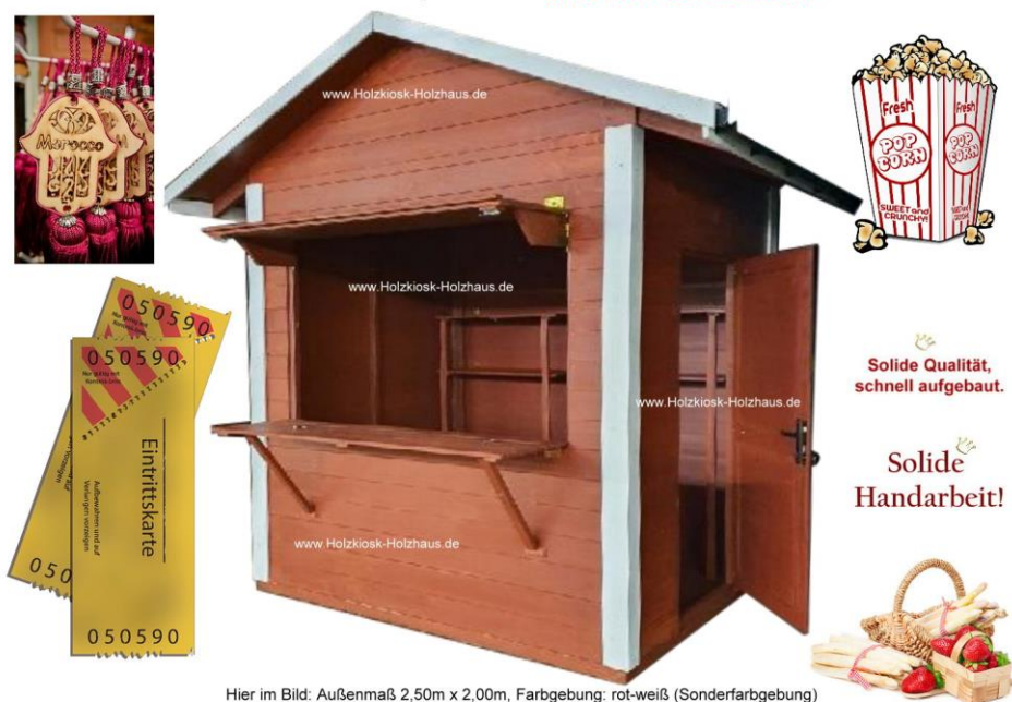
Hier im Bild: Außenmaß 2,50m x 2,00m, Farbgebung: rot-weiß (Sonderfarbgebung)

Platzsparend, robust, durchdacht - das ist unser Modell "Minishop". Sowohl für Verkauf als auch für kleinere Gastronomiekonzepte bestens geeignet. In nahezu jeder Größe für Ihr Projekt herstellbar. Gerne erstellen wir ein individuelles Angebot für Sie: info@holzkiosk-holzhaus.de