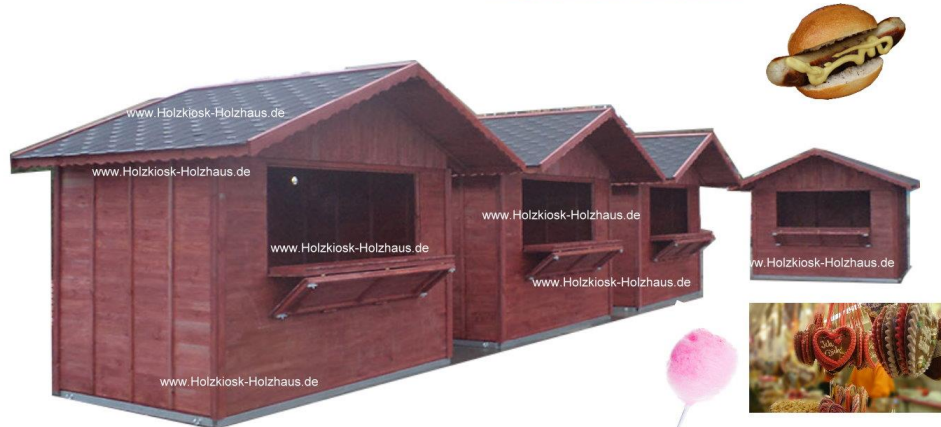
Hier im Bild: 3,00mx2,00m Holzfarbgebung: zeder, verzinkter Stahlrahmen mit Kranösen (Extranfertigung)

Gerne erstellen wir ein individuelles Angebot für Sie: info@holzkiosk-holzhaus.de