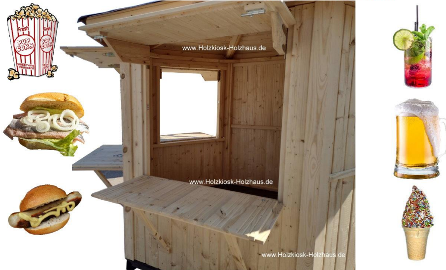
Hier im Bild: Durchmesser 3,00m, Farbgebung: FARBLOS/NATUR (Fußboden: palisander) imprägniert innen und außen

Gerne erstellen wir ein individuelles Angebot für Sie: info@holzkiosk-holzhaus.de