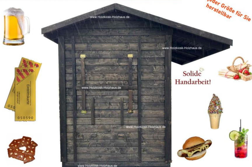
Hier im Bild: Außenmaß 2,50m x 2,00m, Farbgebung: im Farbton "Palisander" imprägniert, mit Stahlrahmen, PVC_Rolläden, Dachüberstand vorne 100cm