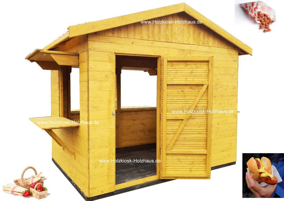
Hier im Bild: Außenmaß 3,00m x 2,00m / Farbgebung Hüttenkorpus: "Kiefer", Fußboden: "Palisander"

Ob für Spargelverkauf, als kleine Imbisshütte oder als Verkaufshütte auf dem Weihnachtsmarkt/Kirmes - unser Modell "Stadtfest" ist ein echter "Alleskönner". Wie immer bei uns - in (fast) jeder benötigten Größe herstellbar! Die Anzahl, Größe und Position von Verkaufsklappen passen wir individuell nach Ihren Vorgaben an. Gerne erstellen wir ein individuelles Angebot für Sie: info@holzkiosk-holzhaus.de