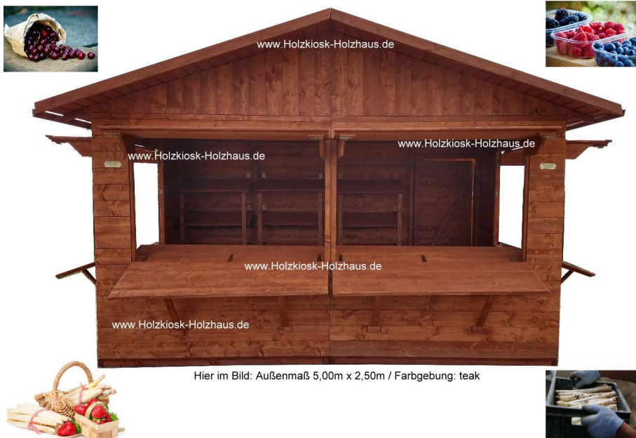
Hier im Bild: Außenmaß 5,00m x 2,50m / Farbgebung: teak