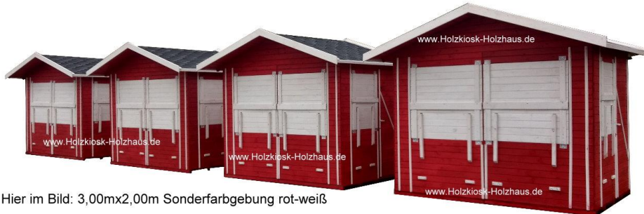
Hier im Bild: 3,00mx2,00m Sonderfarbgebung rot-weiß

Gerne erstellen wir ein individuelles Angebot für Sie: info@holzkiosk-holzhaus.de