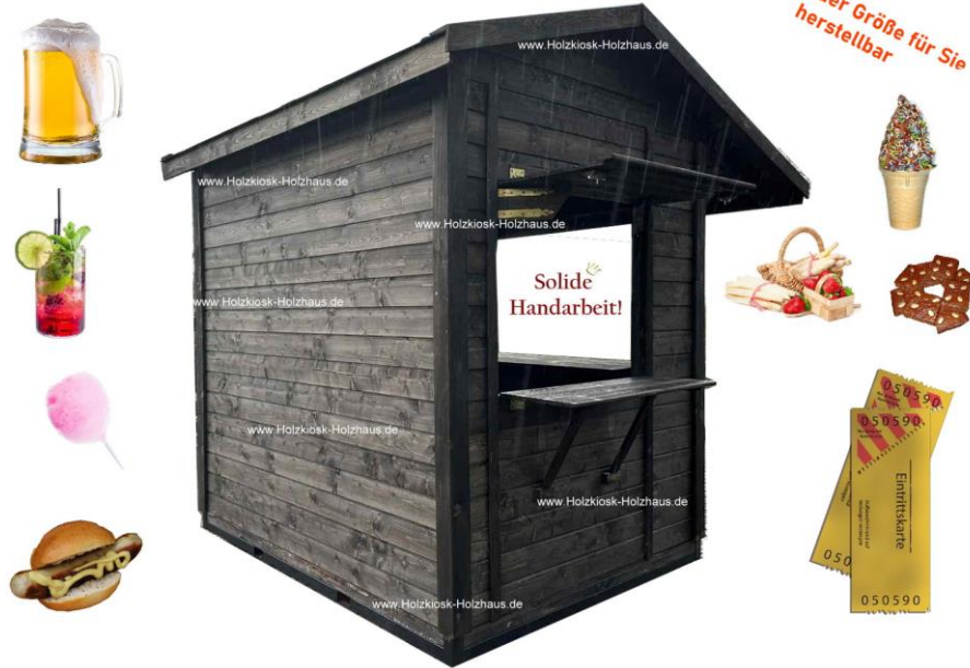
Hier im Bild: Außenmaß 2,50m x 2,00m, Farbgebung: im Farbton "Palisander" imprägniert, mit Stahlrahmen, PVC_Rolläden, Dachüberstand vorne 100cm