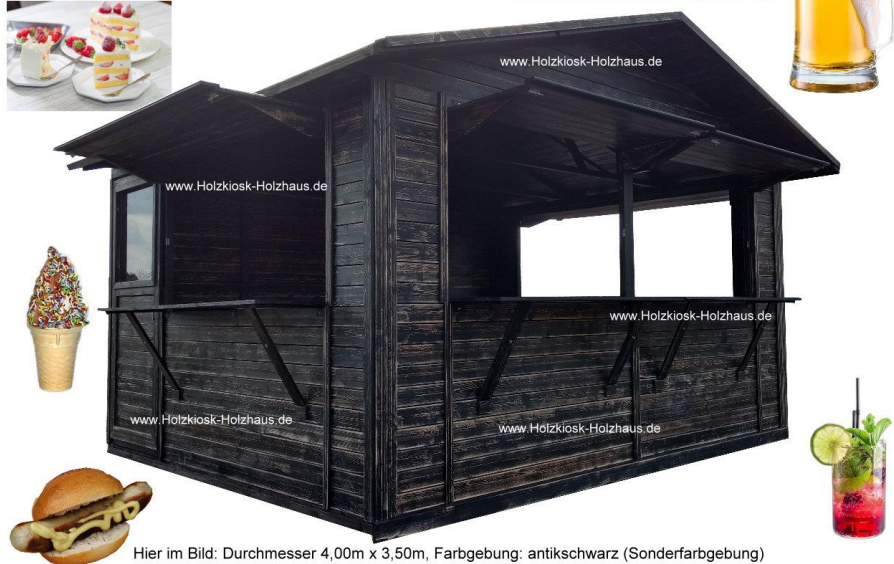
Hier im Bild: Durchmesser 4,00m x 3,50m, Farbgebung: antikschwarz (Sonderfarbgebung)

Gerne erstellen wir ein individuelles Angebot für Sie: info@holzkiosk-holzhaus.de